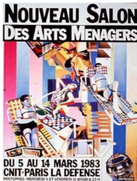
Affiche du Nouveau Salon des Arts Ménagers, 1983